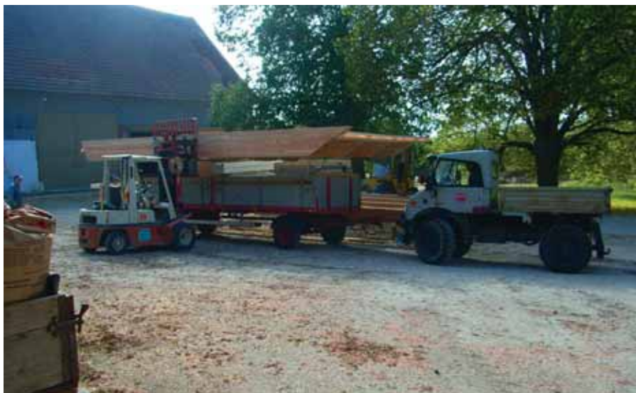
■ Die 2 großen Holzelemente wurden auf dem Friedhofsparkplatz gebaut.

Die einzelnen Elemente sind jeweils 4,50 Meter breit und je nach späterem Gebäudeteil zwischen 6 Meter (Aufbahrungsraum) und 11,20 Meter lang. Aufgrund dieser Ausmaße war eine Fertigstellung der zwei großen Segmente auf dem Stengelehof nicht möglich. Weder Gewicht noch Länge hätten einen Transport vom Hof an den Friedhof zugelassen.