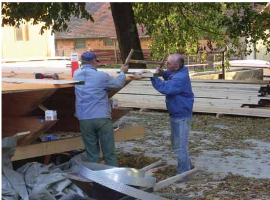
■ Die einzelnen Segmente werden gebaut.

Die außergewöhnliche Länge und Schwere der Holzleimbinder machten die Arbeiten aufwendig. Zum Abbinden der Konstruktionshölzer und das Fertigen der Dachelemente wurde auf dem Stengelehof extra eine Halle ausgeräumt. Die ganze Hoffläche war für die Aussegnungsstätte belegt. Daneben mussten die täglichen Zimmerarbeiten der Zimmerei Markus Veit möglichst ohne größere Einschränkungen weitergeführt werden.